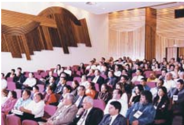
Público participou ativamente de todas as palestras

A imagem tridimensional permitida pelo acrílico também faz a diferença entre