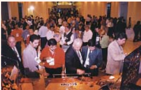
Empresários e executivos prestigiam o maior evento do setor