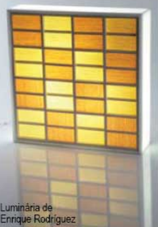
Luminária de Enrique Rodríguez