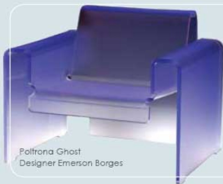
Poltrona Ghost Designer Emerson Borges

CONTATOS: indac@indac.org.br - (11) 3171-0423 (novo) - www.indac.org.br