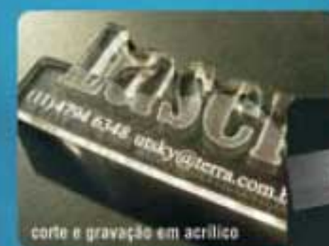
Amostra de acrílico cedida pela Utsky