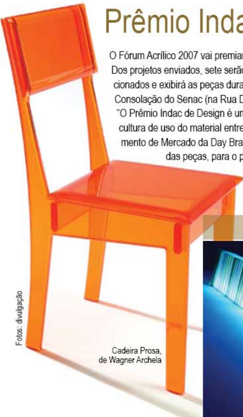
Cadeira Prosa, de Wagner Archela

Indac – (11) 3171-0423 – www.indac.org.br