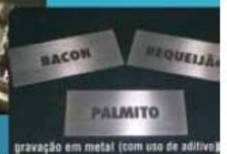
gravação em metal (com uso de aditivo)