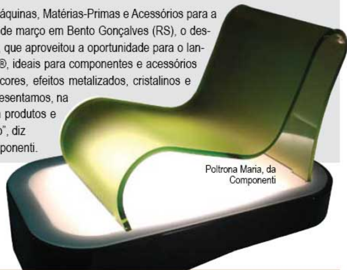
Poltrona Maria, da Componenti

Componenti – (54) 453-5929 – www.componenti.com.br