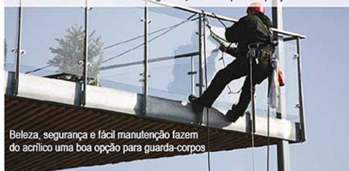
Beleza, segurança e fácil manutenção fazem do acrílico uma boa opção para guarda-corpos

Quatro a cinco vezes mais resistentes que os vidros, as chapas acrílicas usadas para guarda-corpos são formuladas para ampliar ainda mais o desempenho, especialmente em uma aplicação em que a confiança na durabilidade é essencial e a segurança é vital para o projeto.