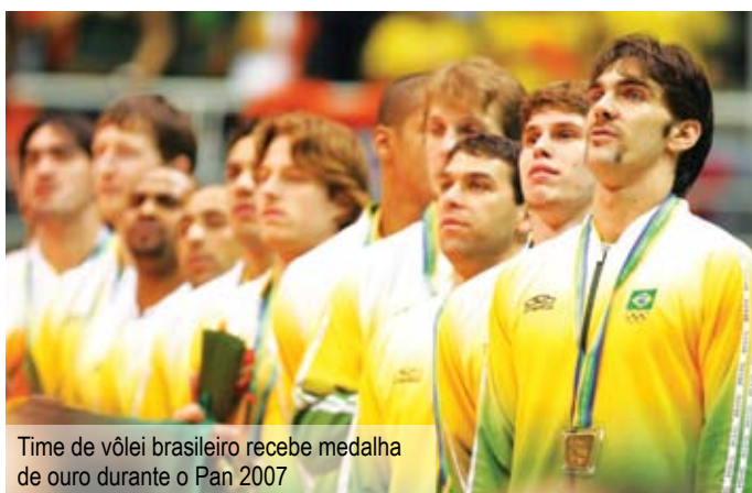
Time de vôlei brasileiro recebe medalha de ouro durante o Pan 2007