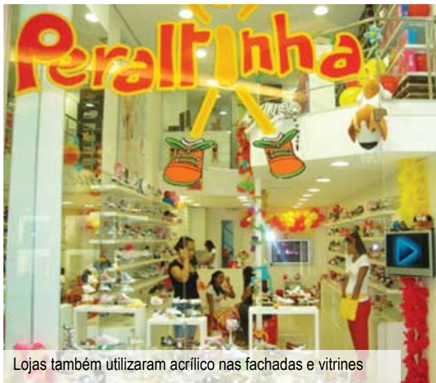
Lojas também utilizaram acrílico nas fachadas e vitrines