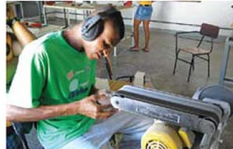
O projeto já capacitou mais de 60 jovens da região

Projeto Jaguará: 75 - 3614-1396 - projetojaguara@hotmail.com