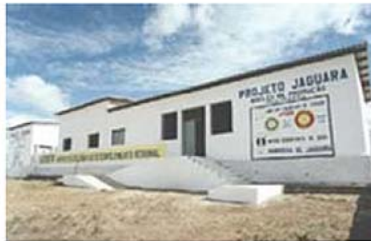
Sede do projeto Jaguará em Feira de Santana (BA)

Essa iniciativa social proporciona capacitação profissional para atuarem no segmento de produção de artefatos de acrílico e até a inclusão no mercado de trabalho. "Nosso objetivo é manter os nativos na sua comunidade de origem proporcionando qualificação e mão de obra, ocupação e renda" finaliza.