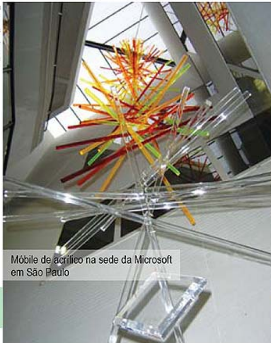
Móbile de acrílico na sede da Microsoft em São Paulo

Cada vez mais, as empresas estão investindo em decorações modernas, e às vezes até futuristas. E isso não é exclusividade apenas dos pontos de vendas, dentro dos escritórios também existe esta preocupação. Este é o caso da empresa americana Microsoft, uma das principais corporações do mundo, presente no Brasil.