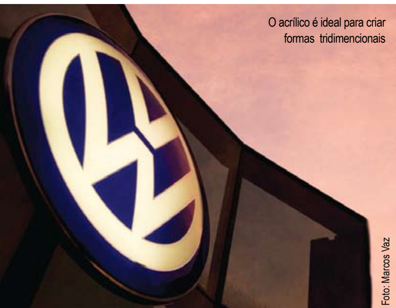
O acrílico é ideal para criar formas tridimensionais