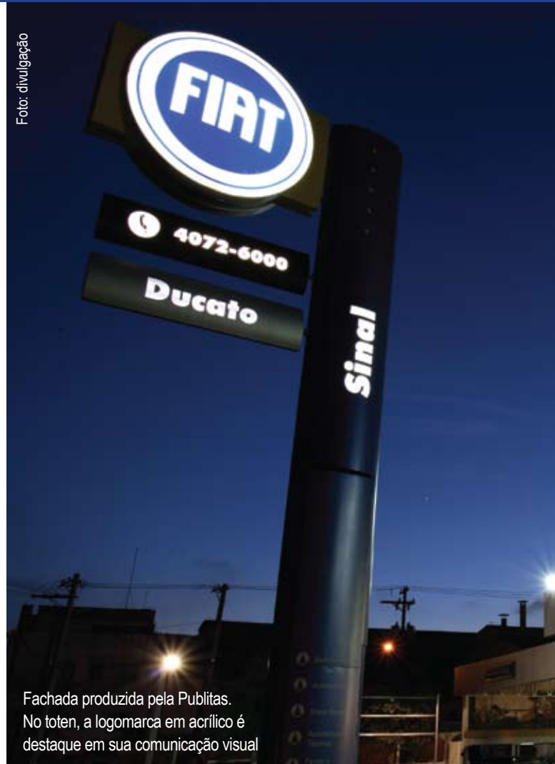
Fachada produzida pela Publitas. No totem, a logomarca em acrílico é destaque em sua comunicação visual

Em comparação com a lona, o acrílico possui muito mais vantagens, tornando-se perfeito para a comunicação visual. Confira.