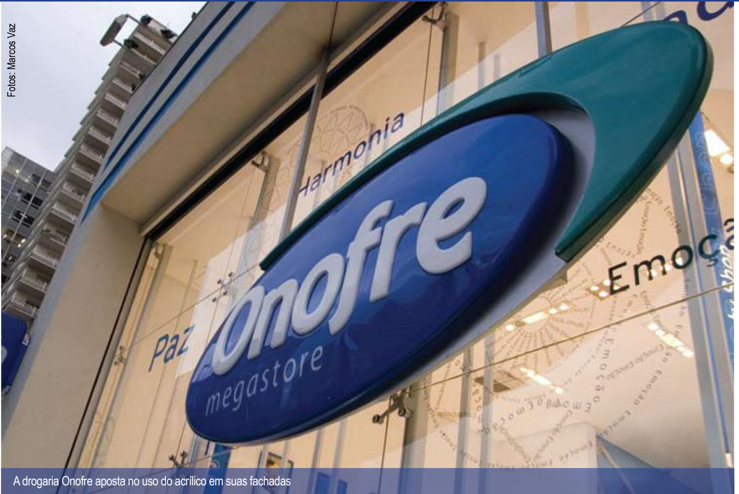
A drogaria Onofre aposta no uso do acrílico em suas fachadas