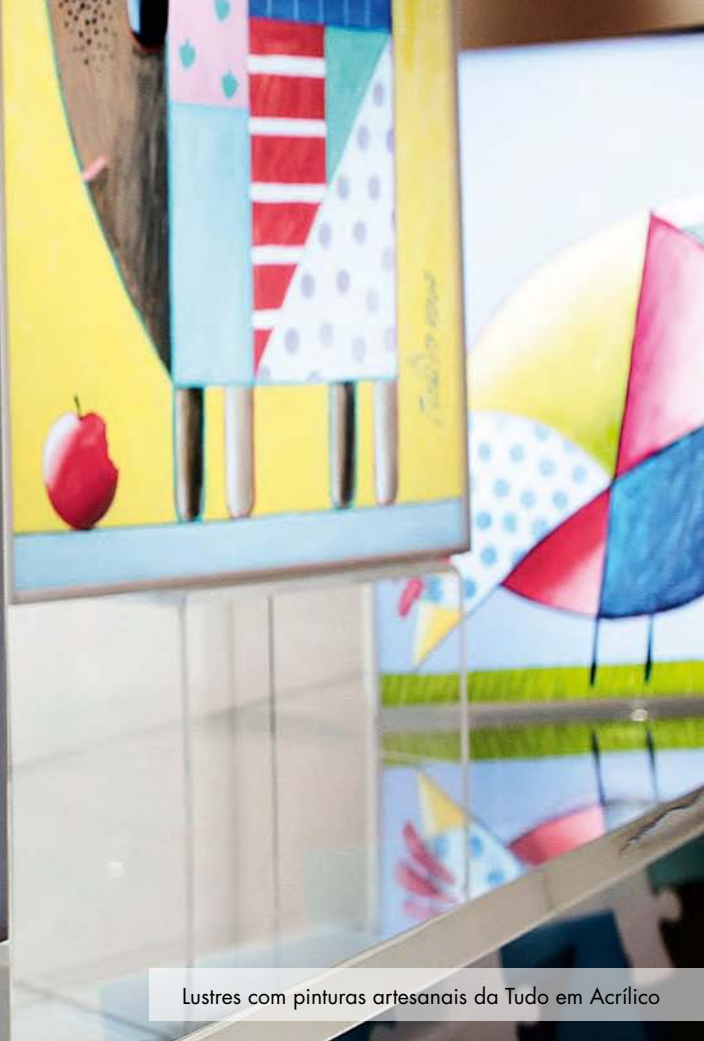
Lustres com pinturas artesanais da Tudo em Acrílico