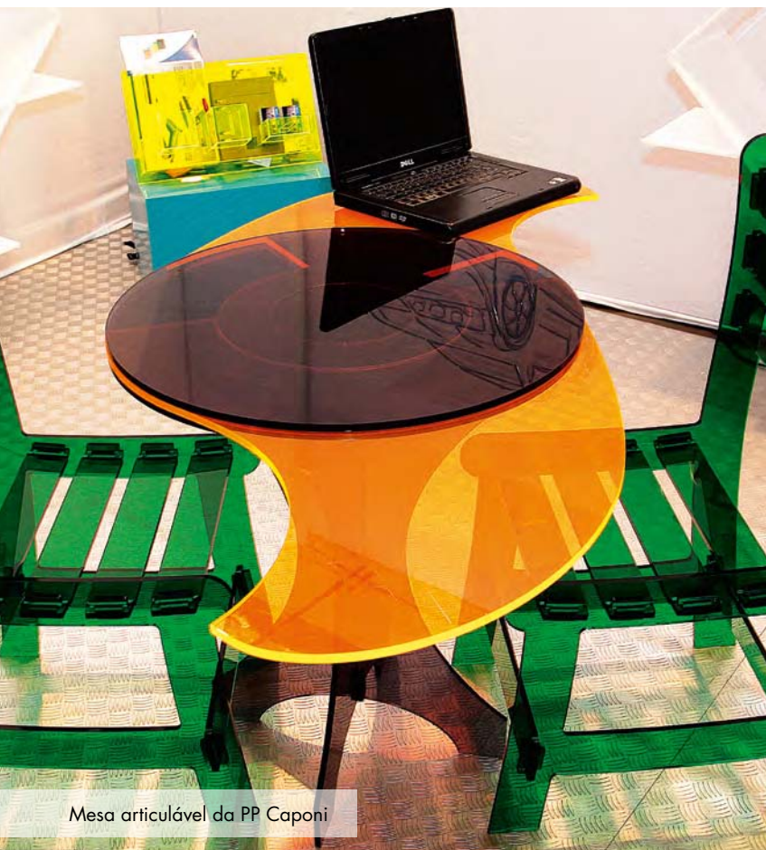
Mesa articulável da PP Caponi