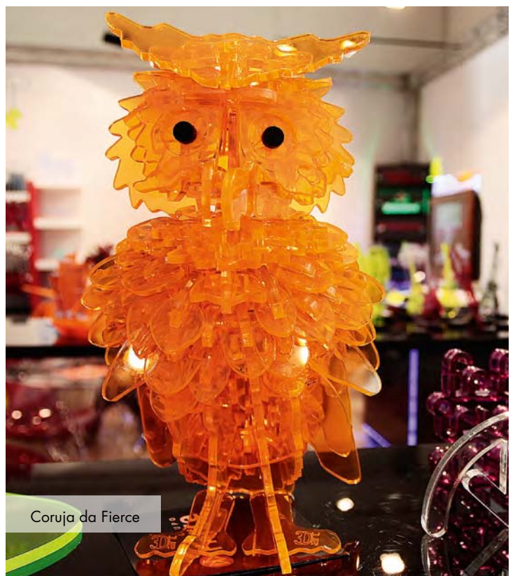
Coruja da Fierce