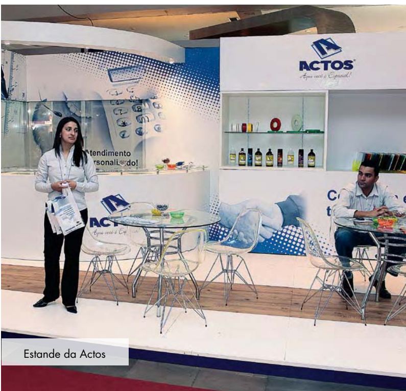
Estande da Actos