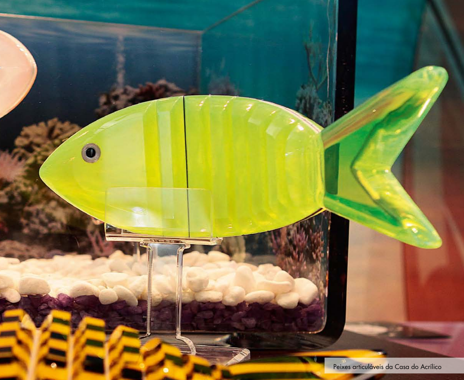
Peixes articuláveis da Casa do Acrílico

a laser. “Fizemos diversos contatos e estamos em processo de negociação.”