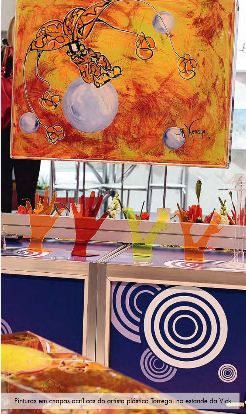
Pinturas em chapas acrílicas do artista plástico Torrego, no estande da Vick

“ O grande destaque deste ano, sem dúvida, foram os expositores e os cuidados que eles dedicaram à montagem de seus estandes ”