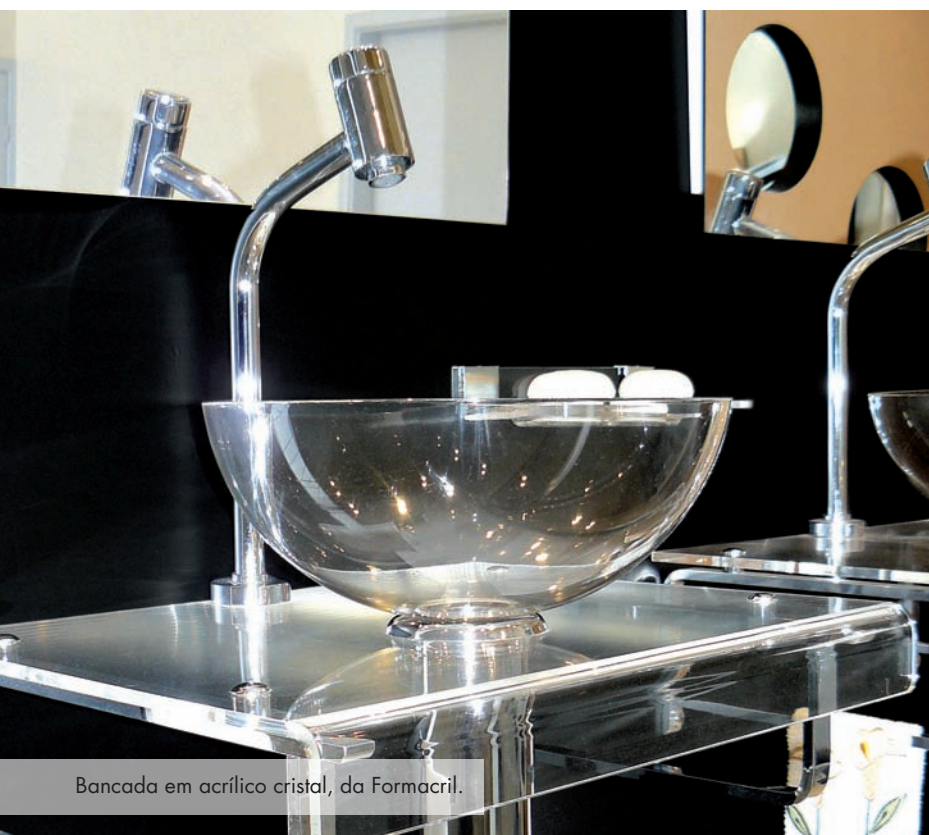
Bancada em acrílico cristal, da Formacril.

A banheira de acrílico também pode ser mais viável para o bolso. “No caso de produção em larga escala, o processo é mais rápido, o que reduz o preço das peças finais em comparação a outros termoplásticos utilizados.”