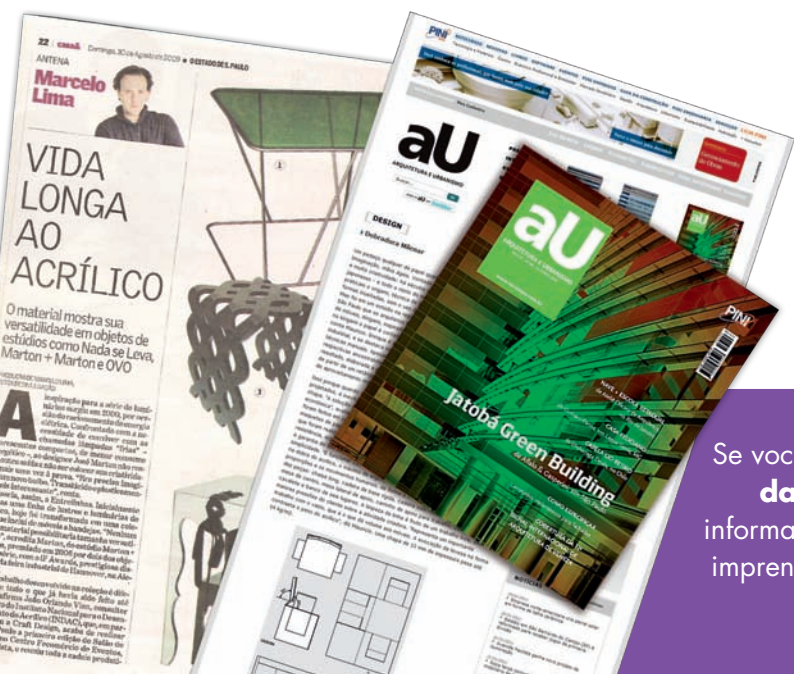
Jornal O Estado de S.Paulo - encarte Casa & Construção Revista e site aU Arquitetura e Urbanismo

Como ver o resultado deste trabalho? Ao final de cada dois meses a assessoria de imprensa do Indac gera um relatório com o retorno parcial das matérias e notas publicadas sobre os assuntos pertinentes nas revistas, jornais e sites selecionados.