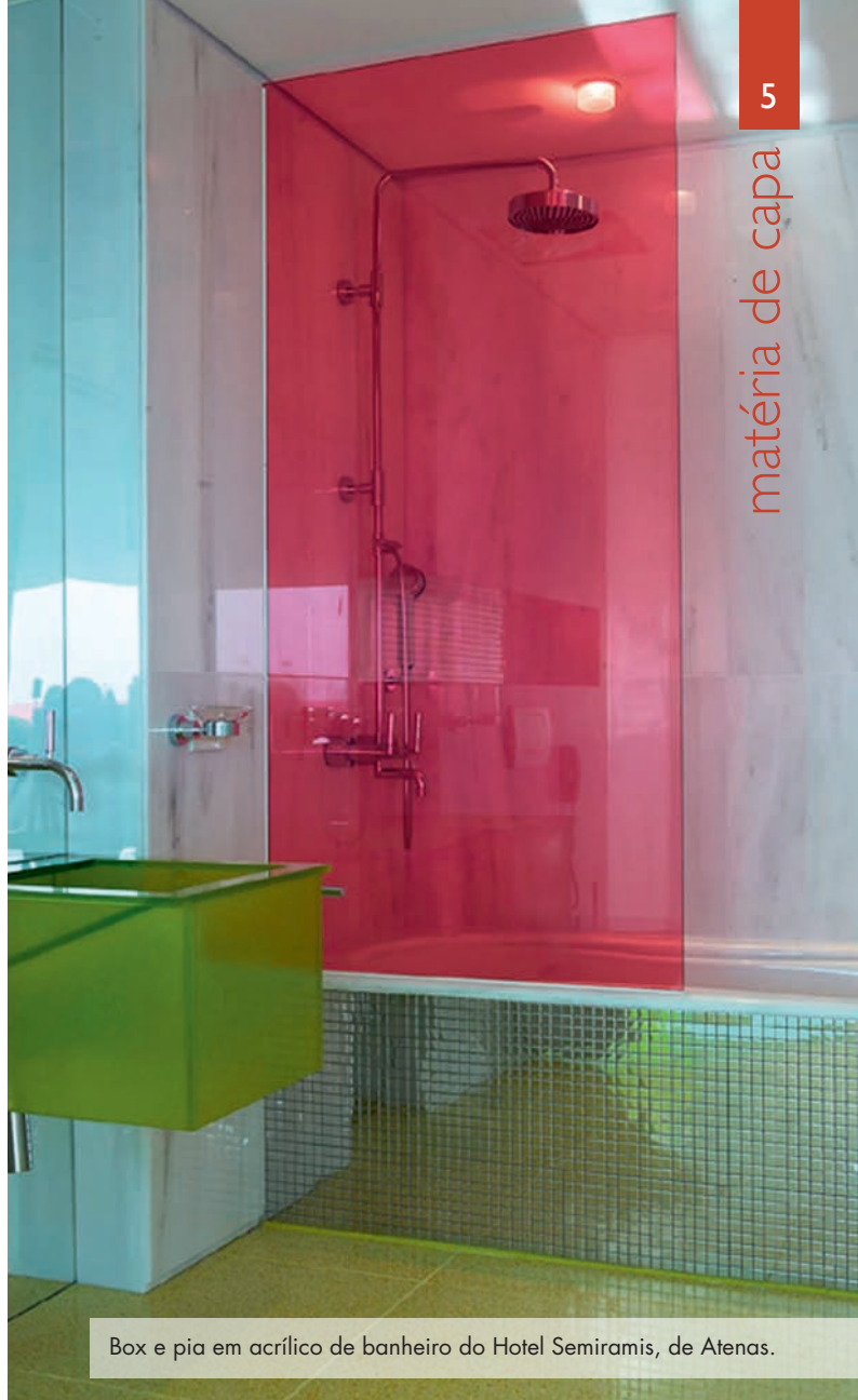
Box e pia em acrílico de banheiro do Hotel Semiramis, de Atenas.

Preocupada com esse índice, a Casa do Acrílico, empresa associada ao Indac, desenvolveu uma espécie de informativo com as propriedades e diferença de cada material. “Nosso objetivo foi orientar consumidores e empresas instaladoras