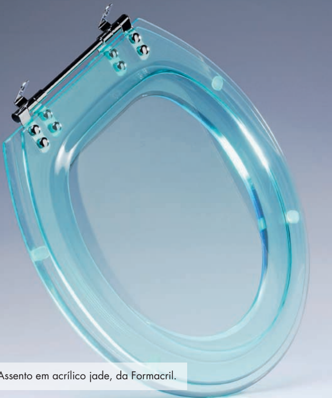
Assento em acrílico jade, da Formacril.

www.lucianapastore.com.br www.berkel.com.br www.formacril.com.br www.casadoacrilico.com.br www.ferrarabrasil.com.br www.metalrpm.com.br