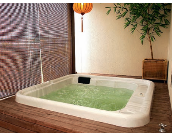
Banheira em acrílico.