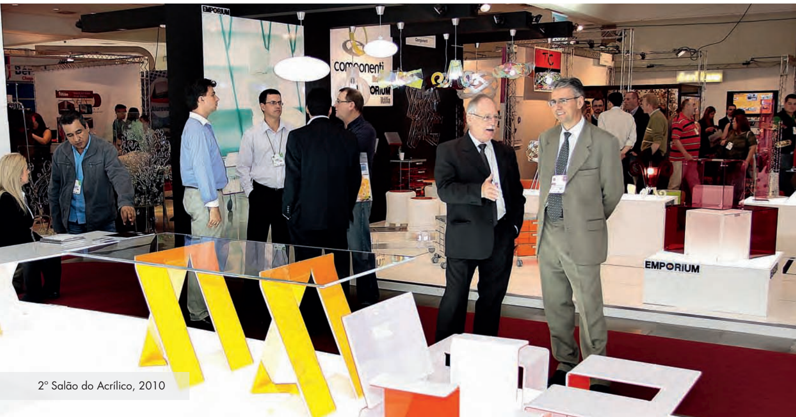
2º Salão do Acrílico, 2010