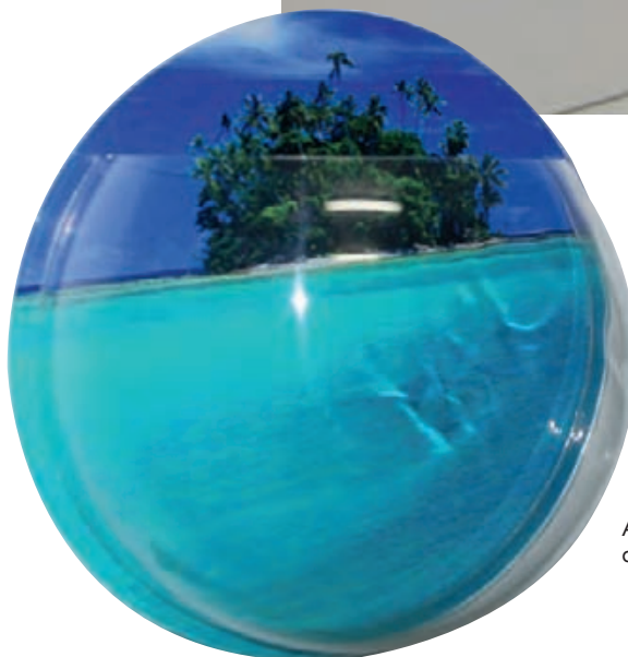
Aquário de parede em acrílico, da Design Laser