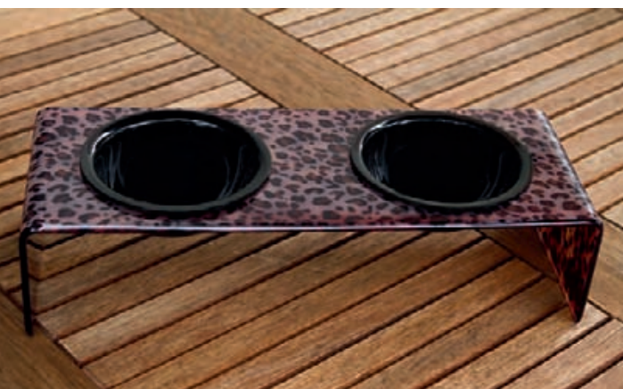
Comedouros em acrílico da Animall Pet Story