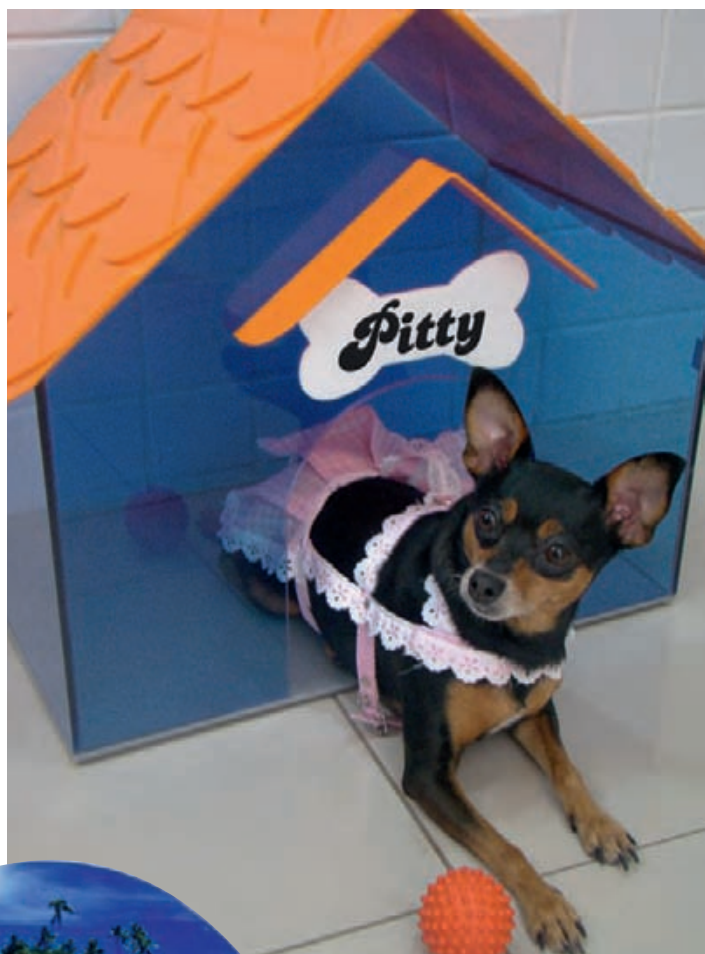
Casinha de cachorro em acrílico, da Emporium