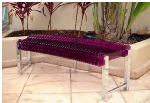
Banco com assento de peças em acrílico em formato de osso, feira Campinas Decor, da Casa do Acrílico