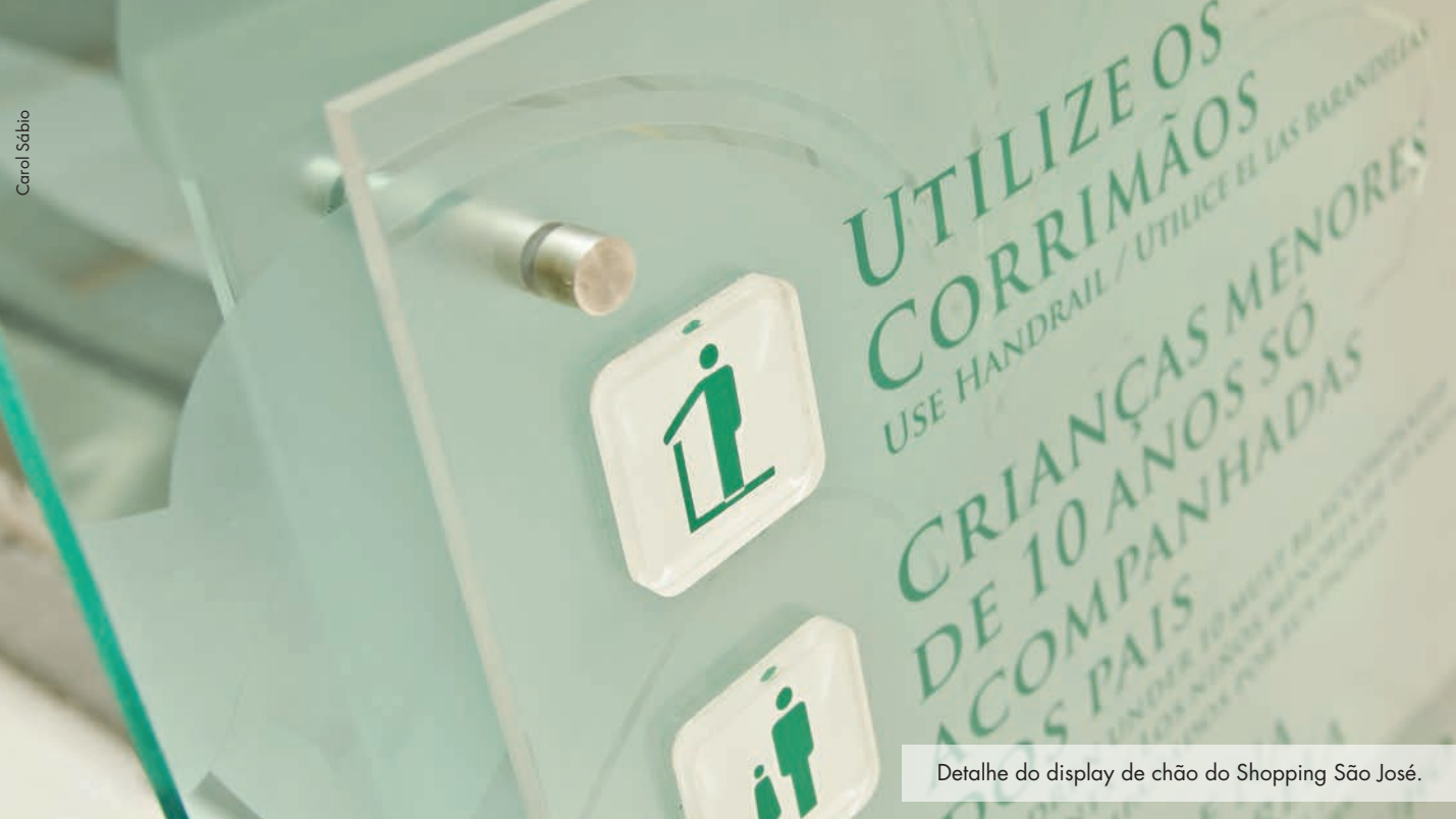
Detalhe do display de chão do Shopping São José.

das tendências do mercado é tornar o shopping não apenas um lugar onde se faz compras, mas sim um espaço atraente e aconchegante, onde as pessoas possam se encontrar para passear, comer ou simplesmente colocar o papo em dia.