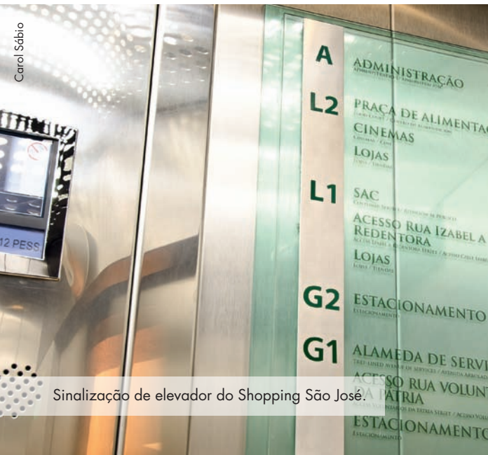
Sinalização de elevador do Shopping São José.

Outro empreendimento que também conta com sinalização interna em acrílico é o Shopping São José, em São José dos Pinhais (PR). Com projeto criado pela Placrim - empresa especializada em comunicação visual - o empreendimento possui sinalização aérea, direcional, indicativa, de sanitários, de garagem e porta-cartaz, tudo produzido com o material. "Na maior parte do projeto, realizado em abril de 2008, optamos pelo acrílico cristal, bastante semelhante ao vidro só que bem mais seguro e, para aumentar ainda mais a resistência, utilizamos uma espessura grossa, de 15 mm", conta Paulo Hey, diretor da Placrim, única empresa de Curitiba associada ao Indac.