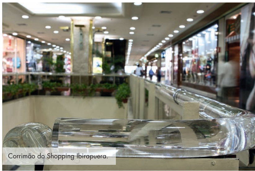
Corrimão do Shopping Ibirapuera.