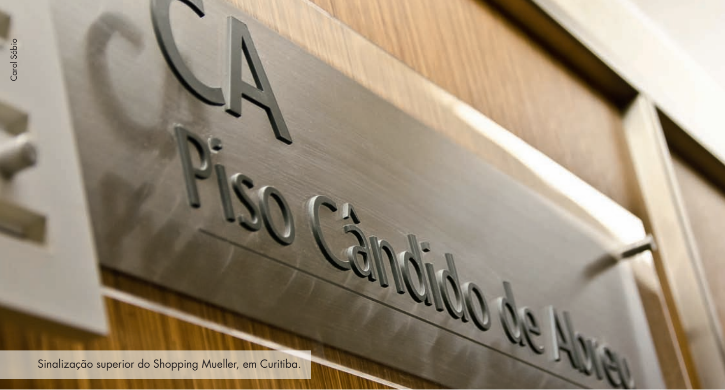
Sinalização superior do Shopping Mueller, em Curitiba.