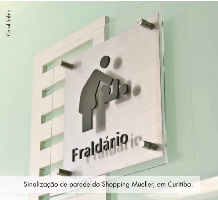
Sinalização de parede do Shopping Mueller, em Curitiba.