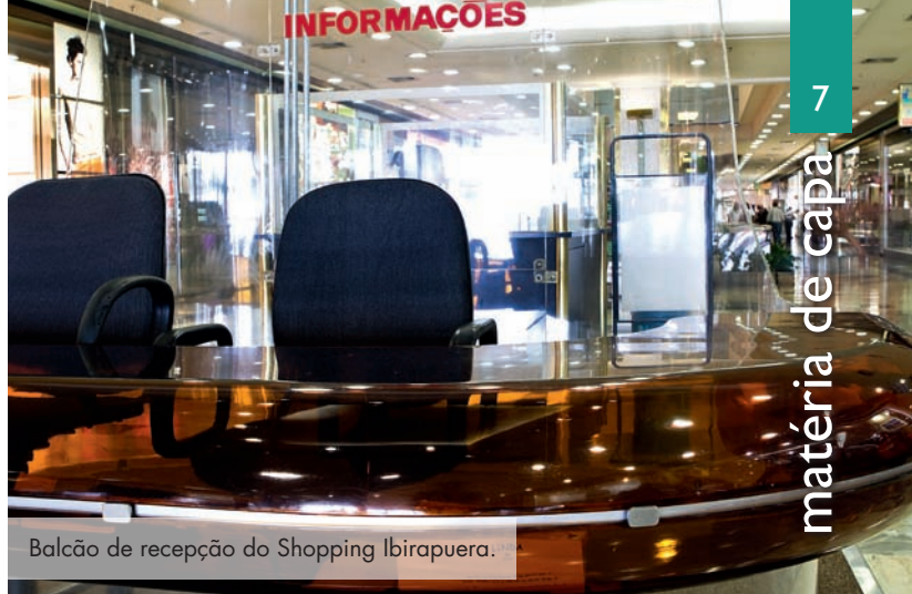
Balcão de recepção do Shopping Ibirapuera.