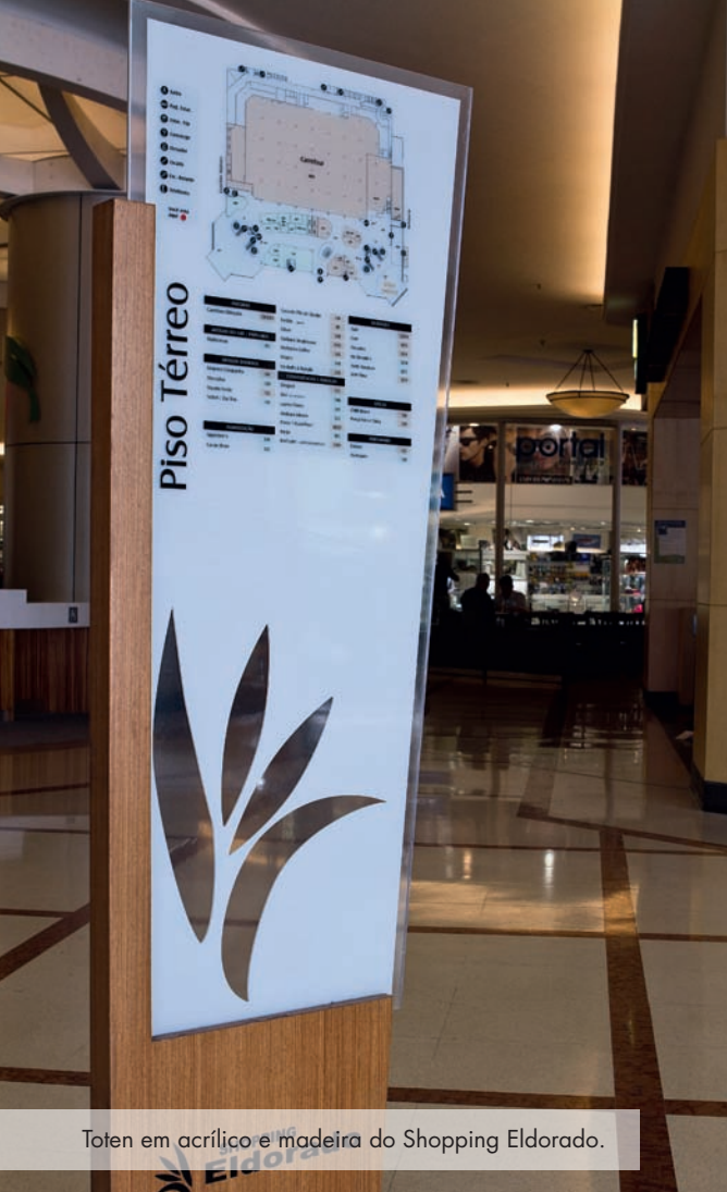
Toten em acrílico e madeira do Shopping Eldorado.